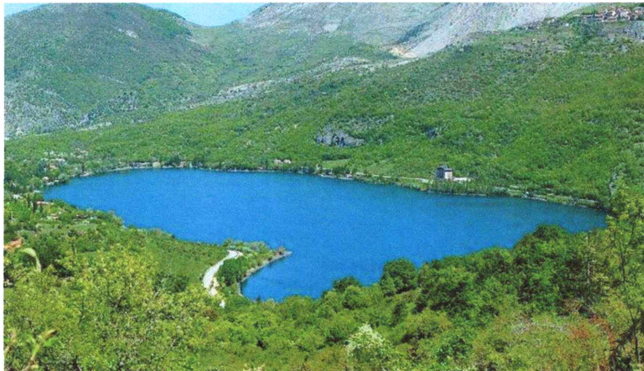
Lago di Scanno (AQ)